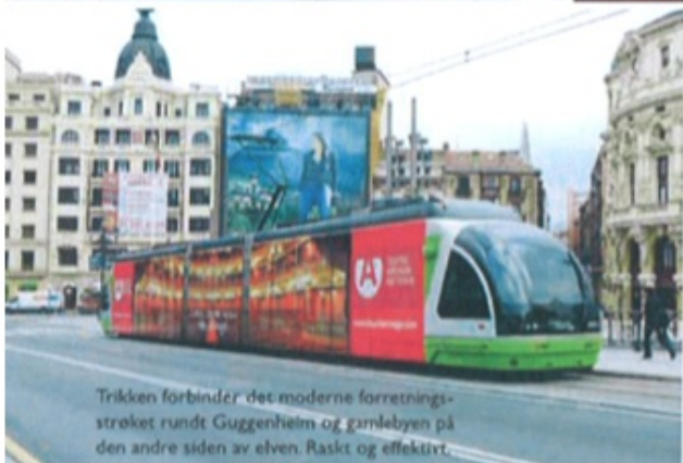
Trikken forbinder det moderne forretningsstrøket rundt Guggenheim og gamlebyen på den andre siden av elven. Raskt og effektivt.