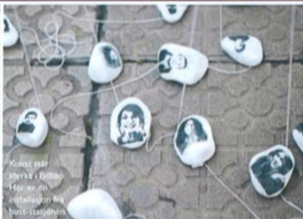
Kunst står sterke i Bilbao. Her er en installasjon fra buss-stasjonen.