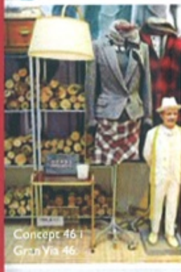
Concept 46 i Gran Vía 46.