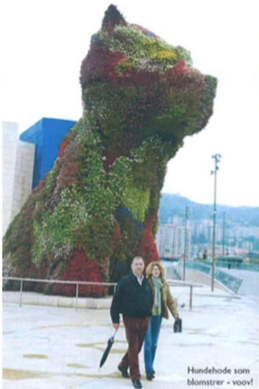
Hundehode som blomstrer - voov!