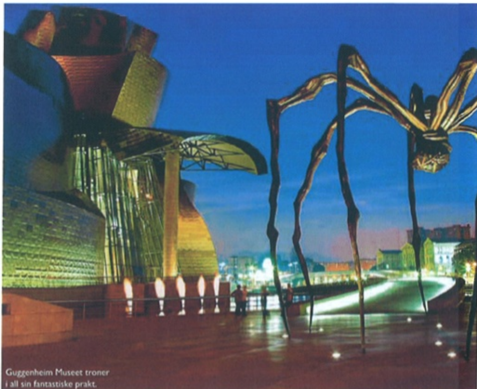
Guggenheim Museet troner i all sin fantastiske prakt.