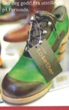
Sko deg godt! Fra utstillingen på Persuade.