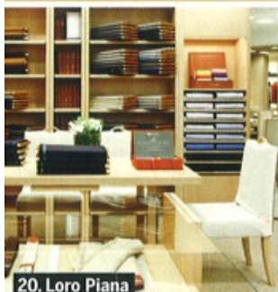
20. Loro Piana